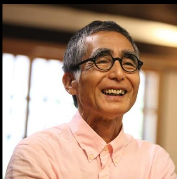
＜設計＞ 大角 雄三氏 (倉敷建築工房/ 大角雄三設計室)